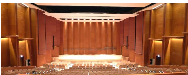
台上備有 Medley 舞台景杆，可用於懸掛佈景及幕布。