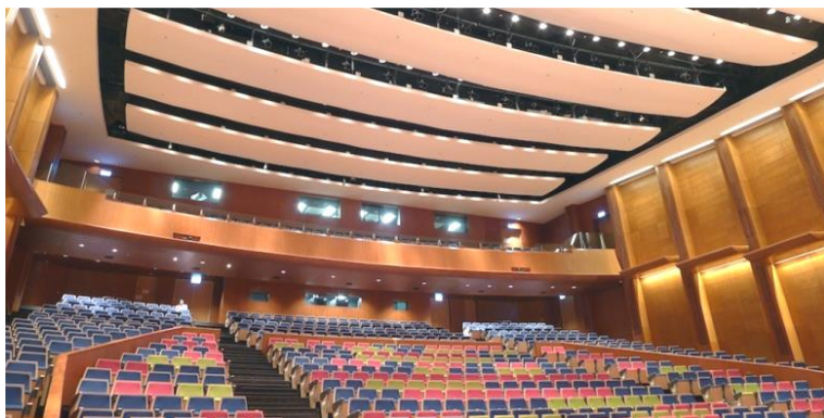
大會堂共安裝了超過 50 台成像燈及聚光燈。